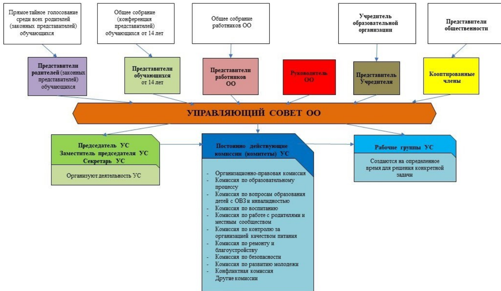
Рис. 1. Модель № 1 – «Управляющий совет общеобразовательной организации» (УС ОО)